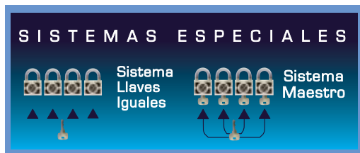
Imagen de igualamiento y amaestramiento